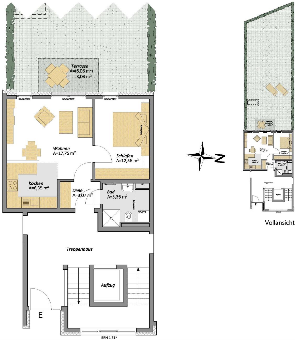
Lage in der Wohnanlage