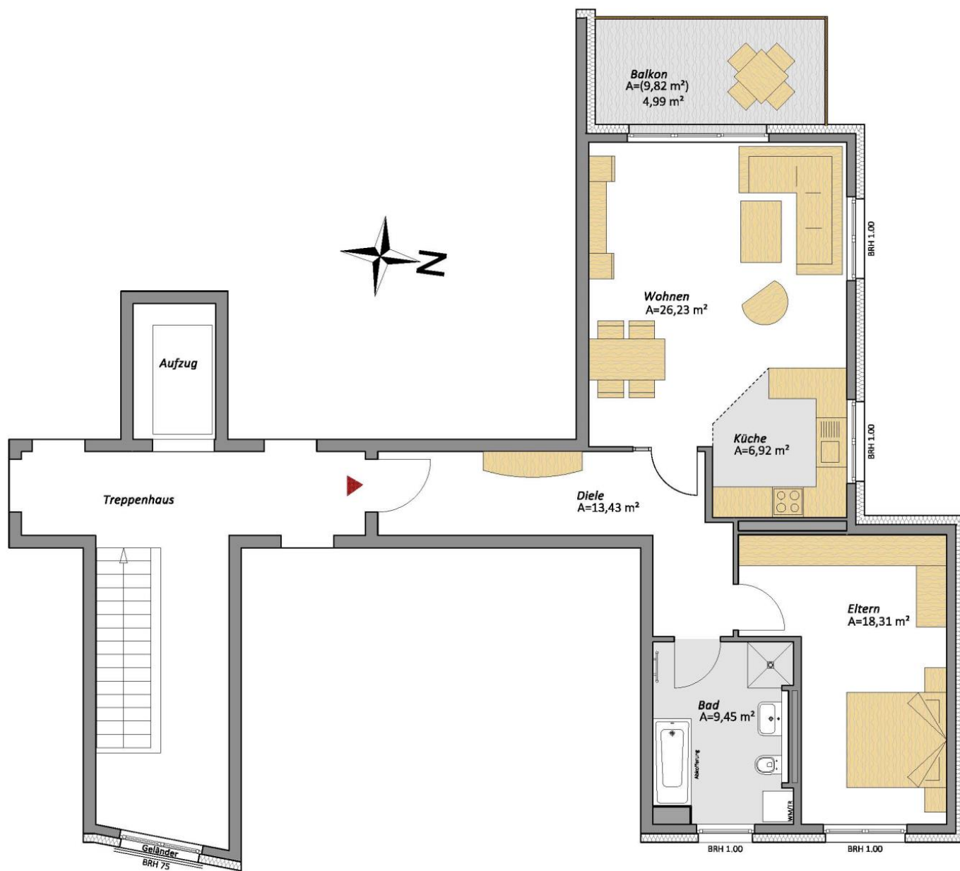
Lage in der Wohnanlage